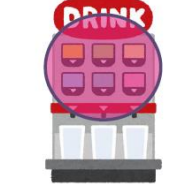
ドリンクサーバー