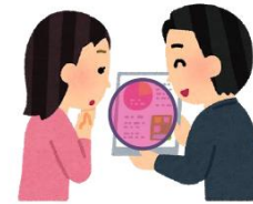
共用のタブレット